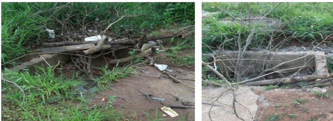
Figura 2. Primeira Área de saída de efluentes estudada. Muzambinho, MG.

A situação atual da primeira área (saída 1) é que o sistema se encontra em estado precário, atrapalhando totalmente seu funcionamento normal, apresentando entupimento devido grande acúmulo de detritos (esgoto) na sua localidade, além de uma grande presença de entulhos (lixo) a montante da entrada do sistema, presença de uma voçoroca a jusante da área, presença de esgoto ao céu aberto e sem tratamento (Figura 2).