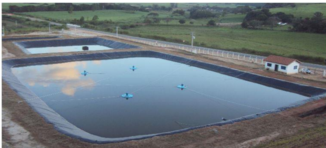
Figura 5. Piscinas de decantação de sólidos da estação de tratamento de sólidos. Tapiratiba - SP.

Tendo em vista o controle da situação, sugere-se a construção das piscinas de decantação de sólidos da estação (Figura 5). Este processo garante a retirada dos sólidos suspensos na água que aumentariam demasiadamente a demanda bioquímica de oxigênio da água (DBO). A elevada DBO faz com as algas presentes na água respirem o oxigênio dissolvido para metabolizar a matéria orgânica suspensa, com isso outros organismos que ocupam o mesmo habitat morrem por asfixia devido o pouco oxigênio dissolvido.