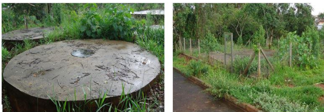
Figura 3. Separador de Sólidos (à esquerda) e Caixa receptora (à direita). Muzambinho, MG.

Percebe-se que a escolha inadequada do sistema definitivo de esgoto causou um problema, que é dever de todos os cidadãos de fiscalizar.