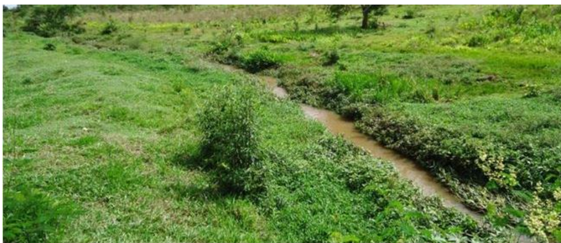
Figura 4. Segunda área analisada (curso de água contaminada). Muzambinho, MG. FONTE: PENHA, E.T.S. (2012).

No segundo estudo (saída 2) percebe-se a presença de substâncias detergentes sob a superfície do riacho, acúmulo de espuma retrata a elevada carga de contaminantes presentes na água, estes por sua vez contribuem excessivamente para a redução da biodiversidade do local (POTT; POTT, 2002). Em observação ao local, não foi presenciado nenhum tipo de vida no curso d'água (peixes, anfíbios, aves, insetos) e áreas adjacentes (Figura 4).